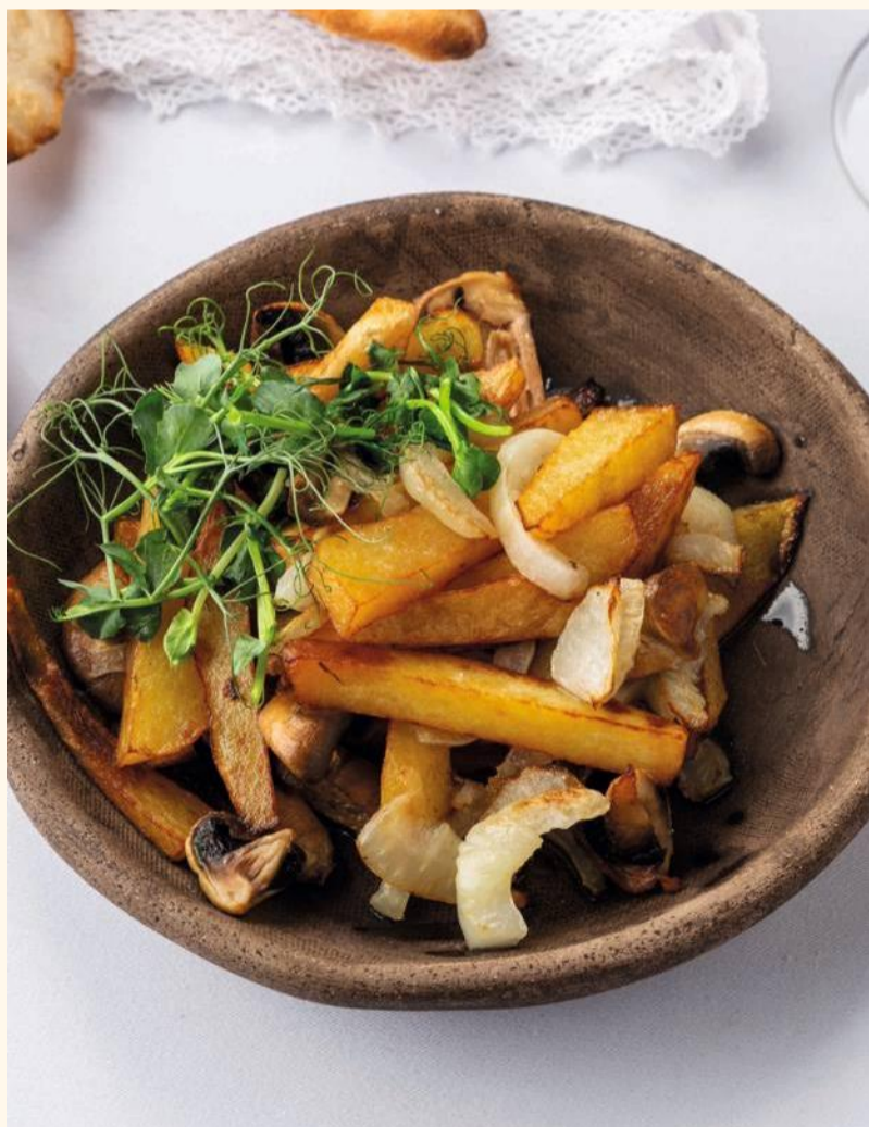
Жареный картофель по-домашнему 340

Картофельные дольки, обжаренные до золотистой корочки с чесноком и укропом.