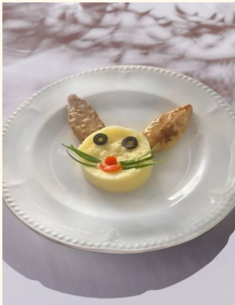
Котлеты с пюре