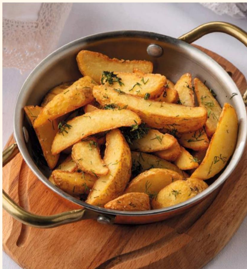
Картофель Айдахо 280

Вешенки, обжаренные на сливочном масле с добавлением зеленого лука, чеснока, тархуна.