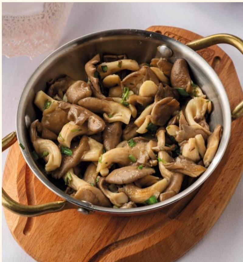
Обжаренные грибы с тархуном 390

Вешенки, обжаренные на сливочном масле с добавлением зеленого лука, чеснока, тархуна.