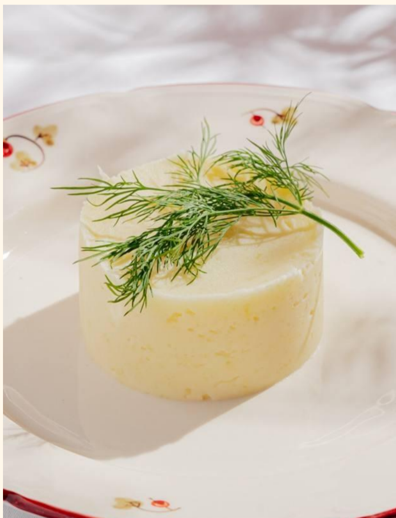
Картофельное пюре 310

Картофель, обжаренный с шампиньонами, луком и специями.