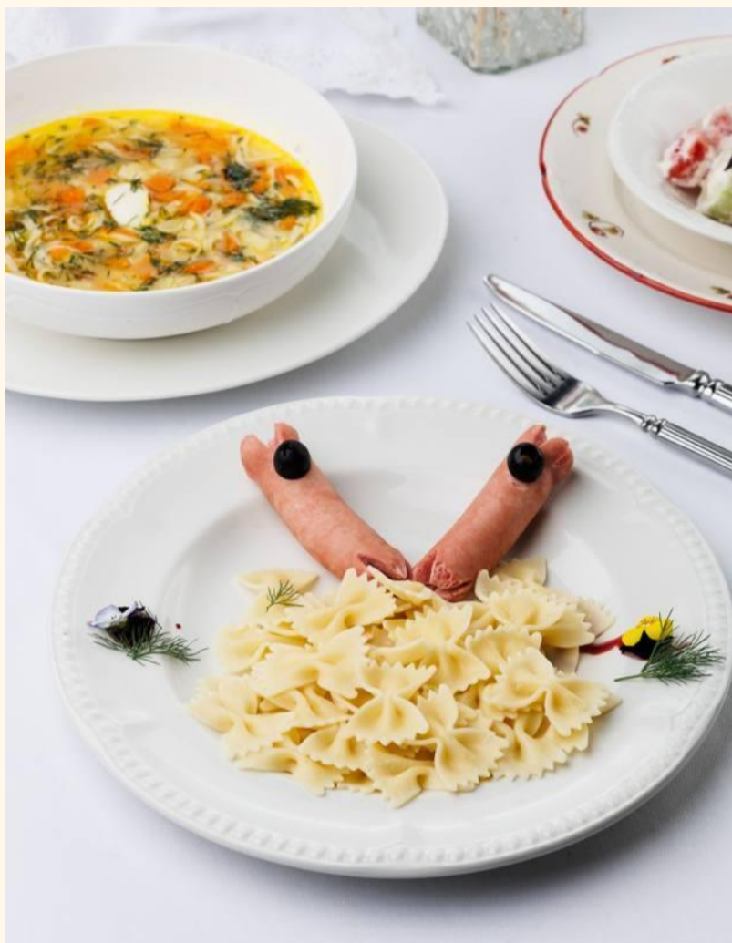
Макароны с сосисками